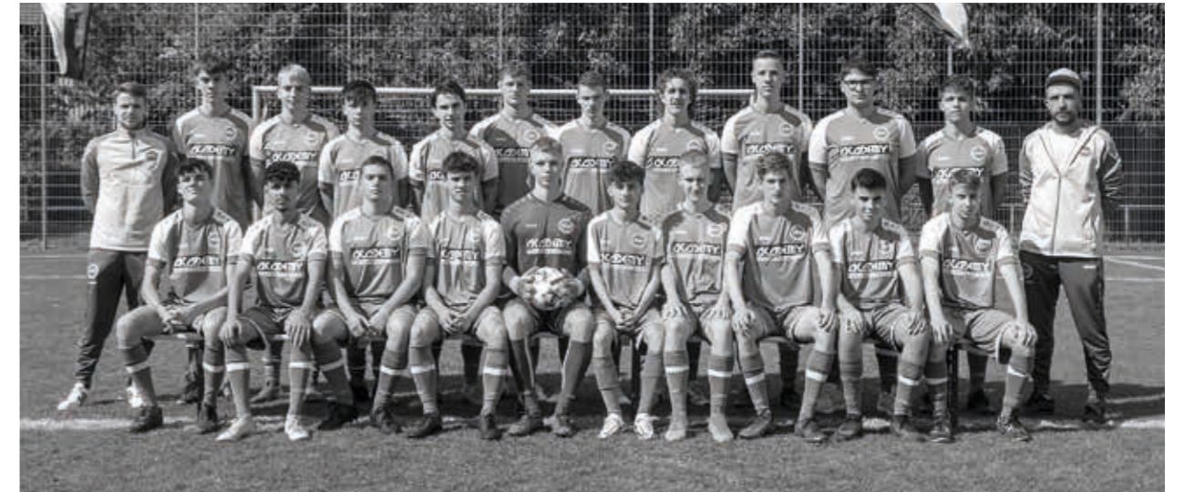
TSV Willsbach Fußball A-Jugend

Unsere C-Junioren erspielten sich einen hervorragenden zweiten Platz. Sie mussten sich nur der