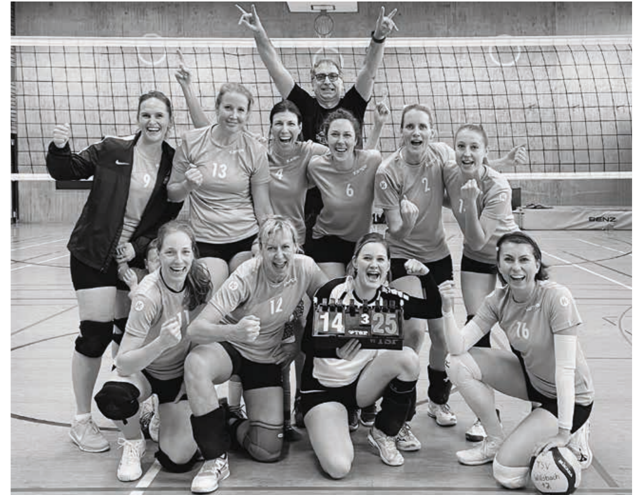
TSV Willsbach Volleyball Damen

Nach der Sommerpause begannen die intensiven, schweißtreibenden Trainingseinheiten, darunter Ausdauerzirkel und Tabata, um uns bestmöglich auf die Landesliga vorzubereiten.