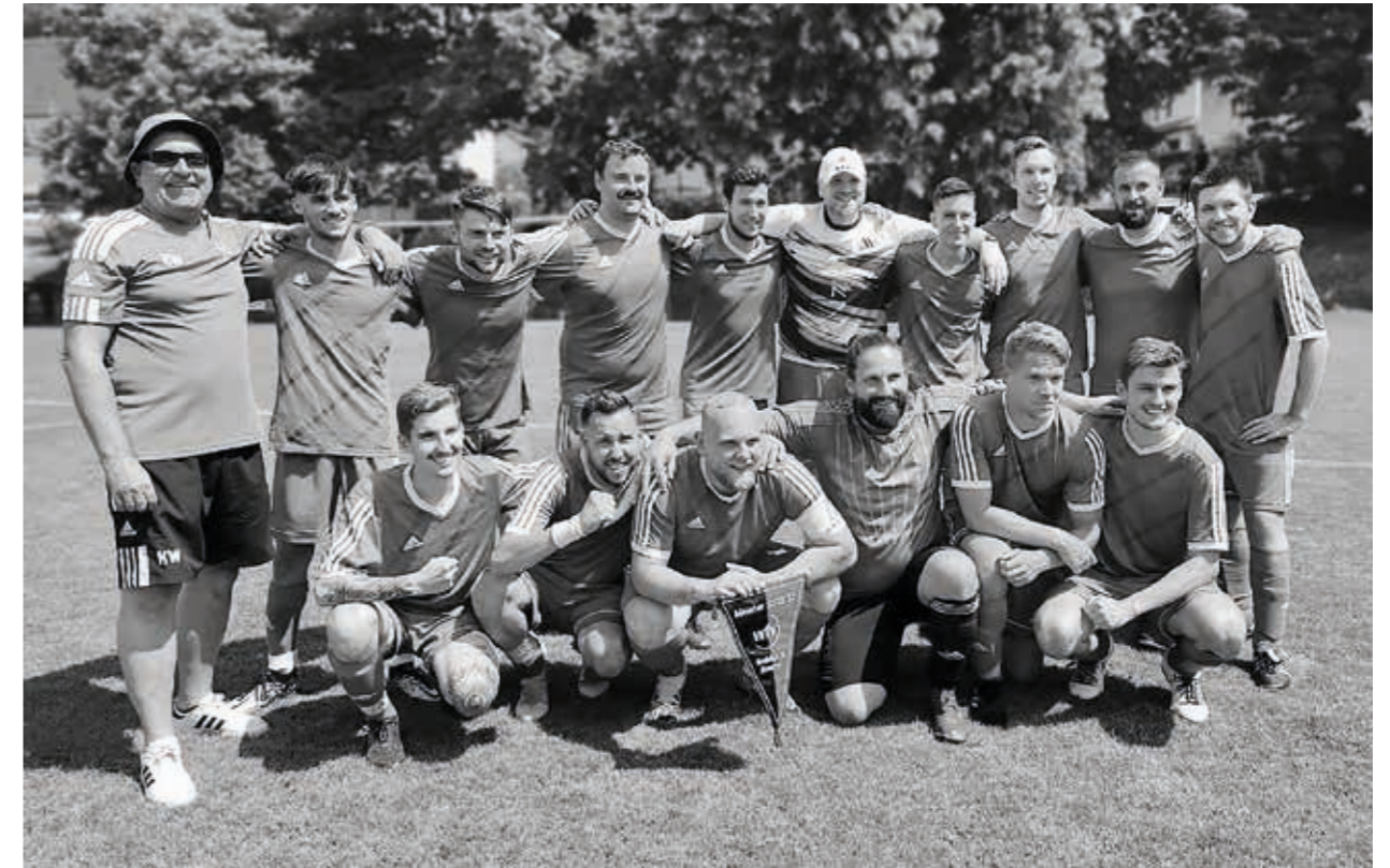
TSV Willsbach Fußball Reserve, Gewinn der Reserve-Meisterschaft 2022/2023