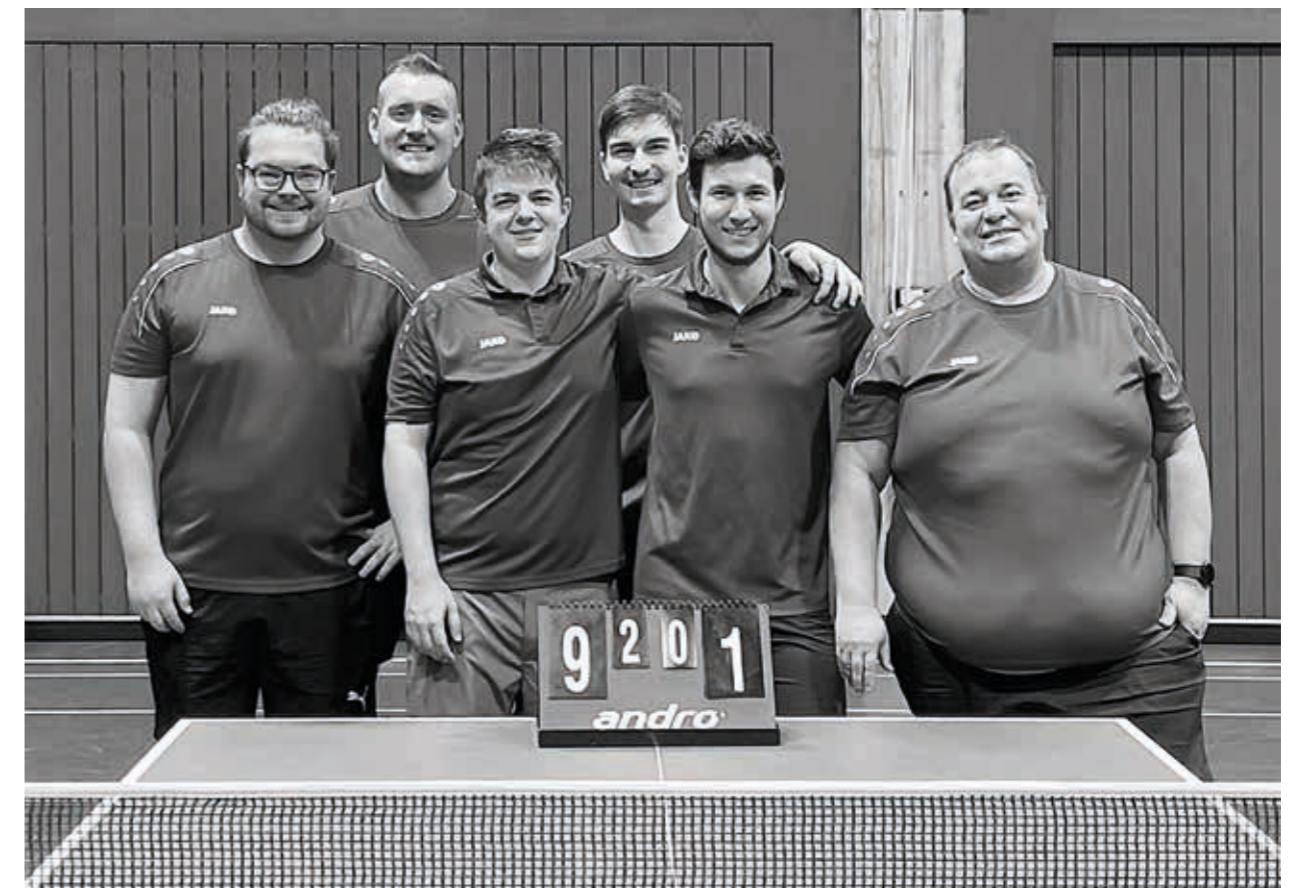
Spieler der Herren I in der aktuellen Saison