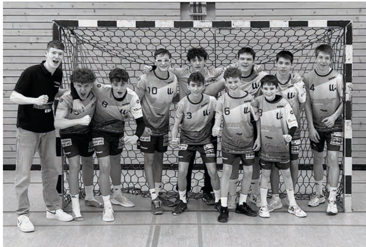
TSV Willsbach Handball männliche B-Jugend, Saison 2023/2024