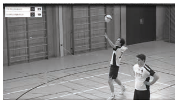
Livestreaming Heimspieltag Herren 2, 28.01.2024, RSO Halle