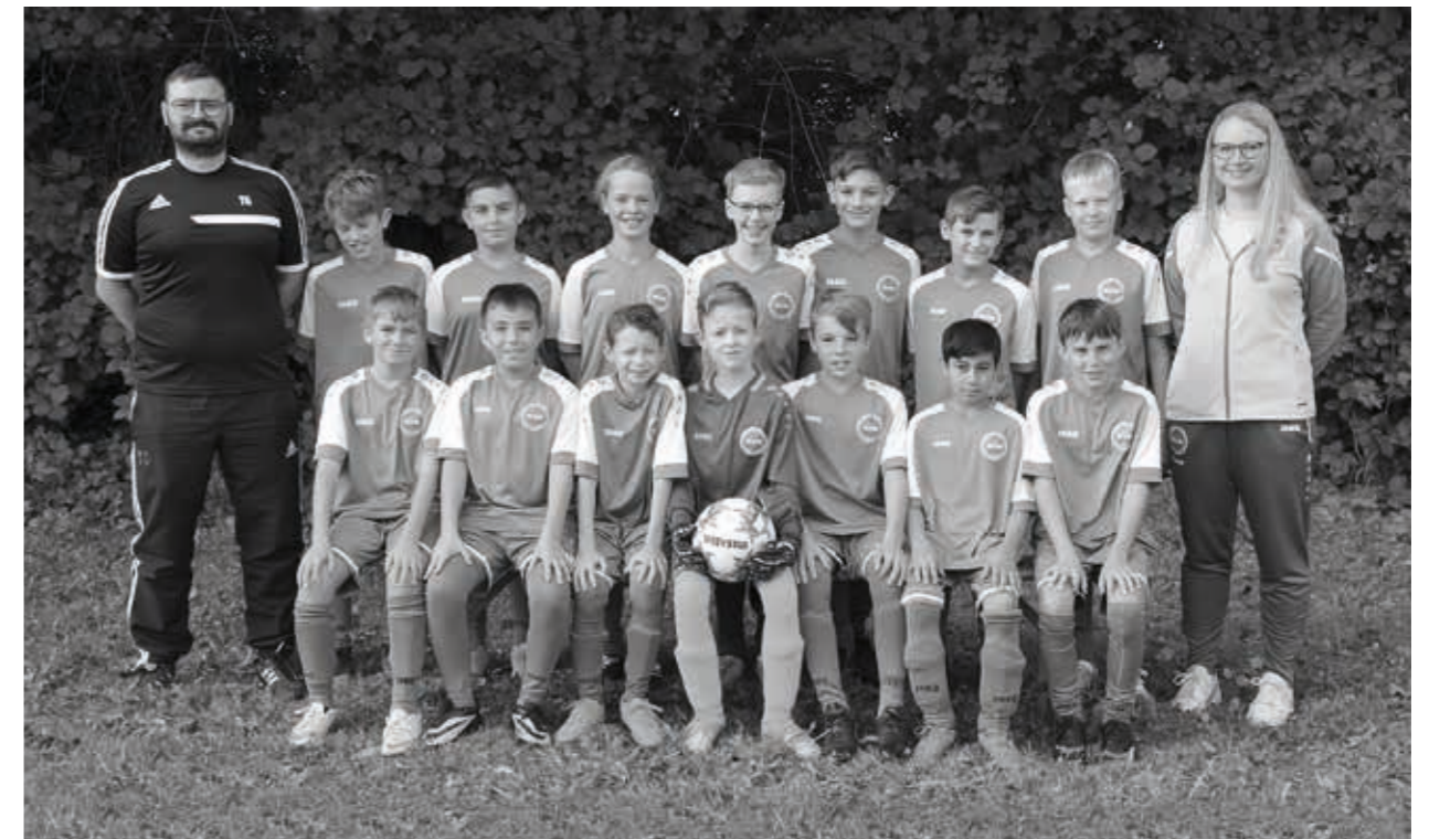
TSV Willsbach Fußball D3-Jugend