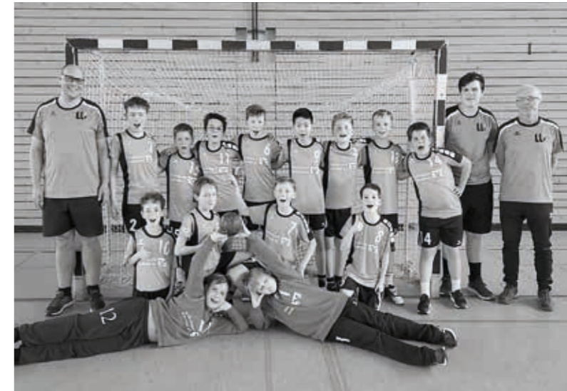
TSV Willsbach Handball gemischte D-Jugend, Saison 2023/2024

Mittwoch 16:30 bis 18:00 Uhr (SCO) Freitag 16:00 bis 17:30 Uhr (SCO)