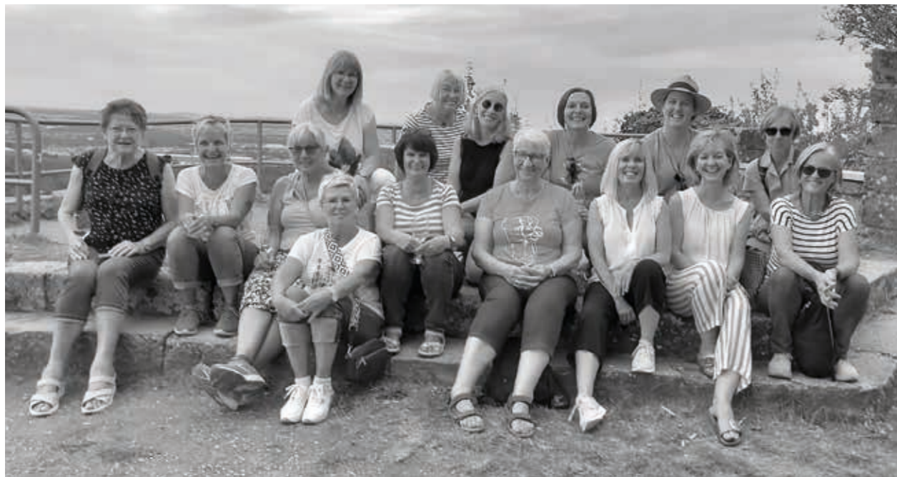
Die Fit&Fun-Gruppe bei der Weinwanderung auf dem Scheuerberg in Neckarsulm