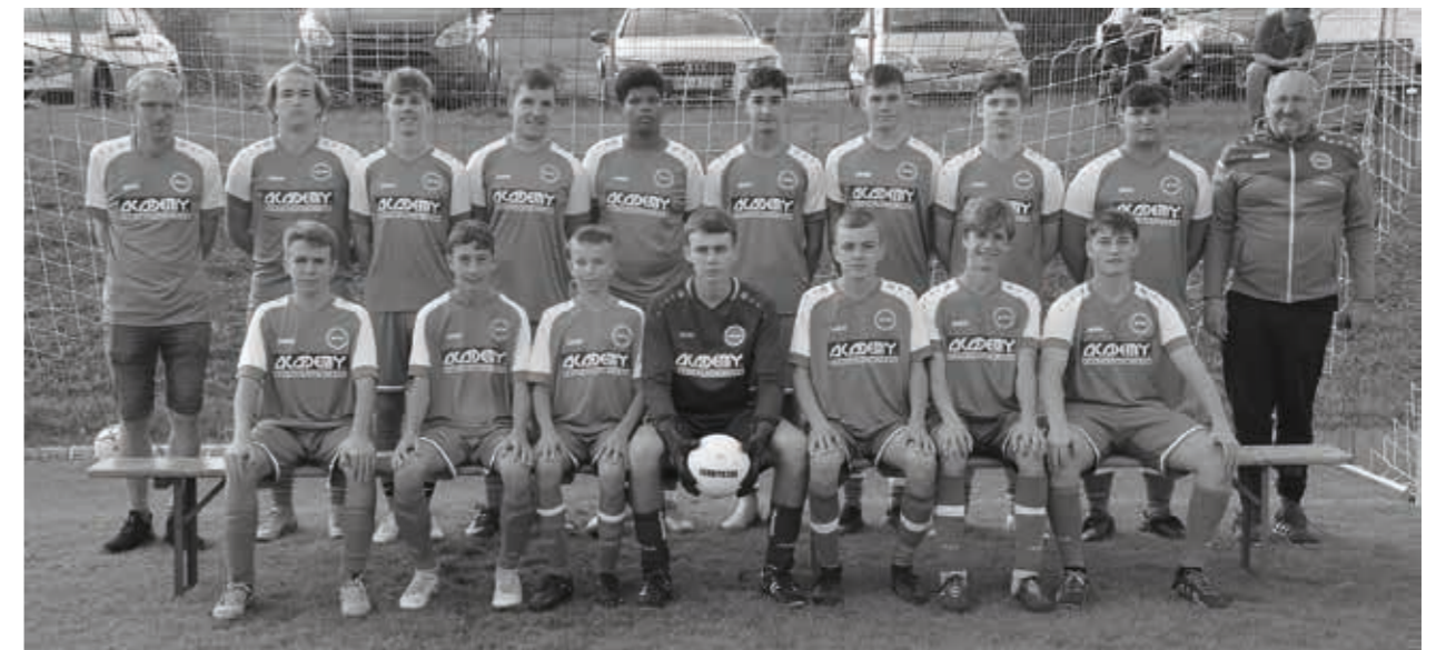
TSV Willsbach Fußball B-Jugend

SGM ABI aus dem Raum Ilsfeld geschlagen geben, so dass auch sie in der Leistungsstaffel angreifen werden.