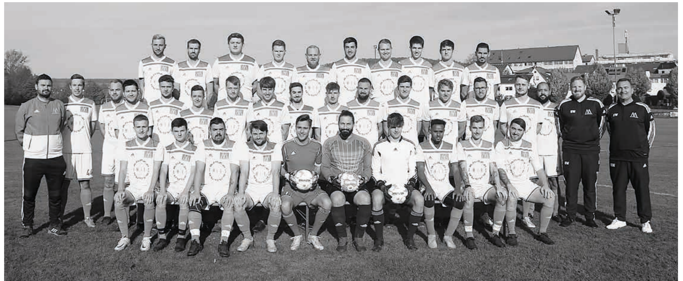
TSV Willsbach Fußball Aktive, Saison 2022/2023