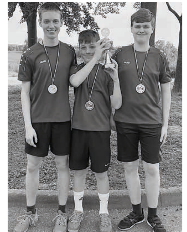
Die Pokalsieger der Jungen 19/1

Um die Saison perfekt zu machen, gewann die Mannschaft der Jungen 19/1 am 21.05.2023 im Final Four den Bezirkspokal. Dort stießen sie im Halbfinale zunächst auf die TG Offenau II, ehe sie im Finale einen klaren 4:1-Sieg gegen TSV Erlenbach einfuhren.