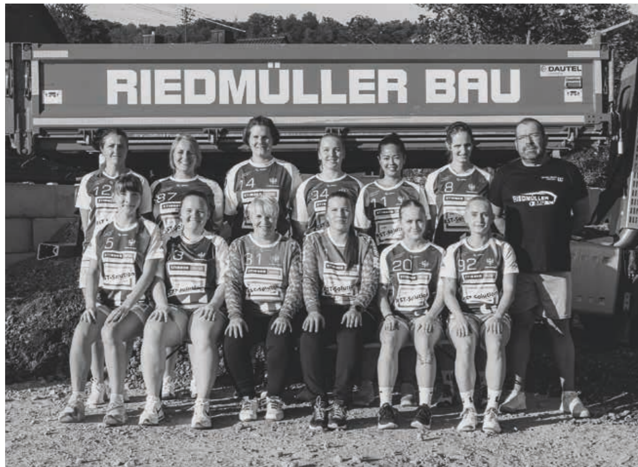
TSV Willsbach Handball Frauen, Saison 2023/2024

Nach dem Aufstieg in die Bezirksliga wollte man auch in der zweiten Saison im vorderen Drittel mitmischen. Nach einer tollen Vorbereitung gab es in den ersten beiden Saisonspielen einen ordentli-