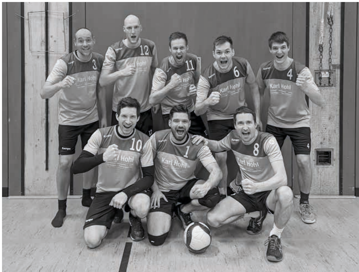
TSV Willsbach Volleyball Herren 1