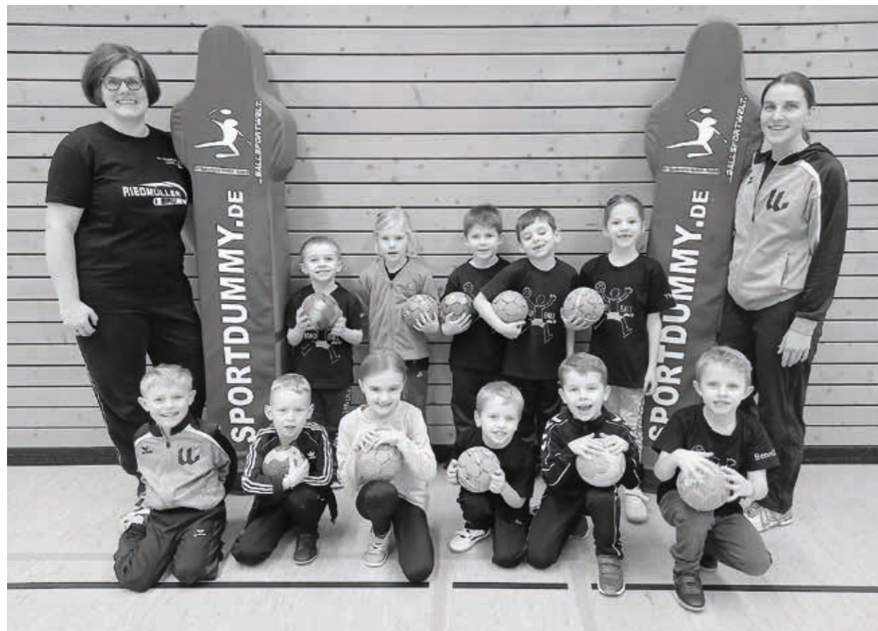
TSV Willsbach Handball Minis, Saison 2023/2024