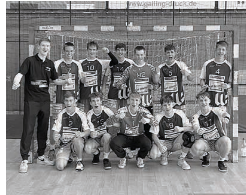
TSV Willsbach Handball männliche A-Jugend, Saison 2023/2024