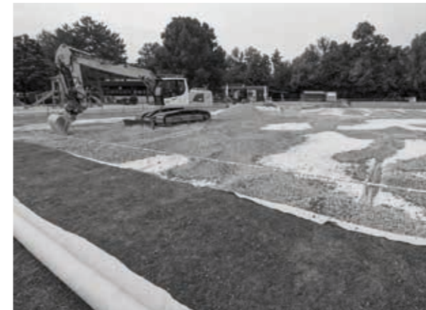
30.06.2023: Das Trennfließ, der Kies sowie die Drainageleitungen wurden gelegt.