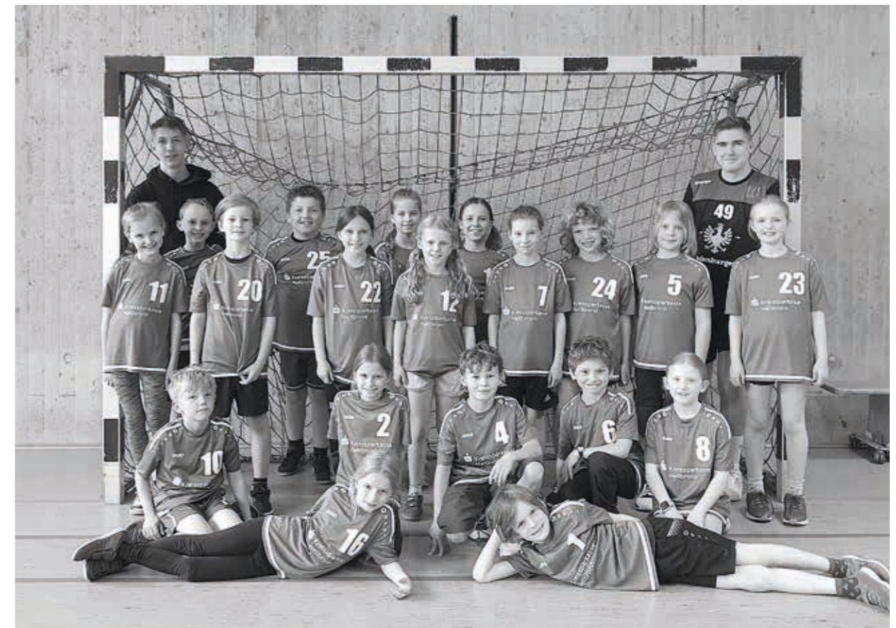
TSV Willsbach Handball gemischte E-Jugend, Saison 2023/2024