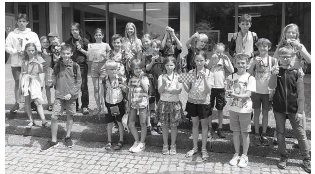
Schulschachturnier in Beilstein