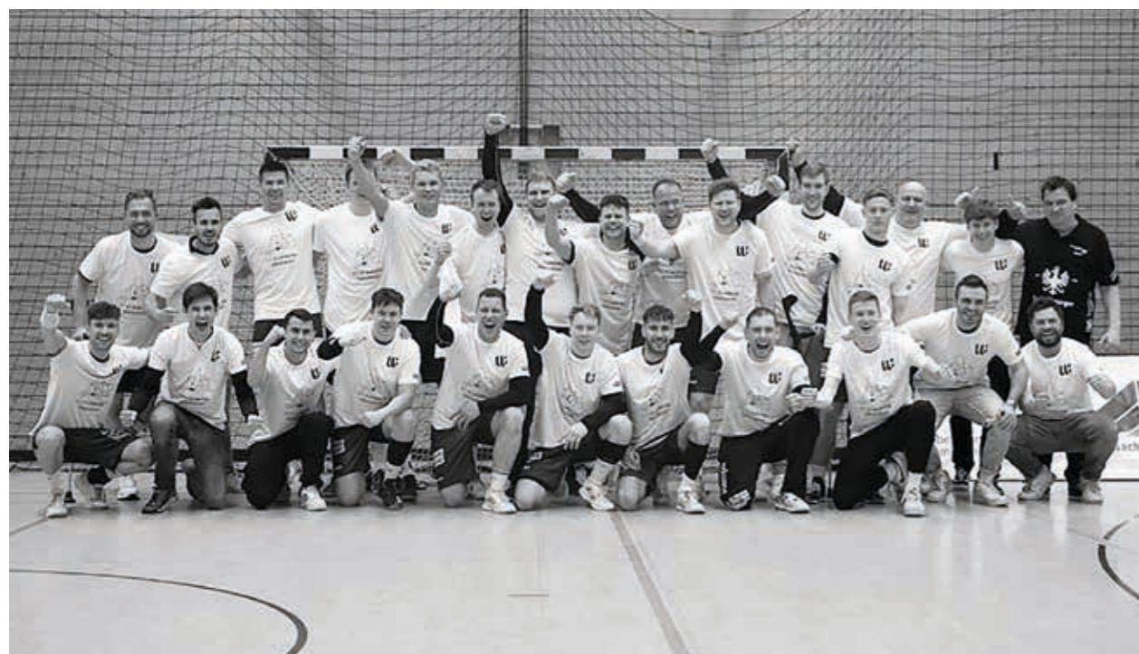
TSV Willsbach Handball Herren 1, Aufstieg in die Landesliga

Mittwoch 20:00 bis 22:00 Uhr (SCO) Freitag 20:00 bis 22:00 Uhr (SCO)