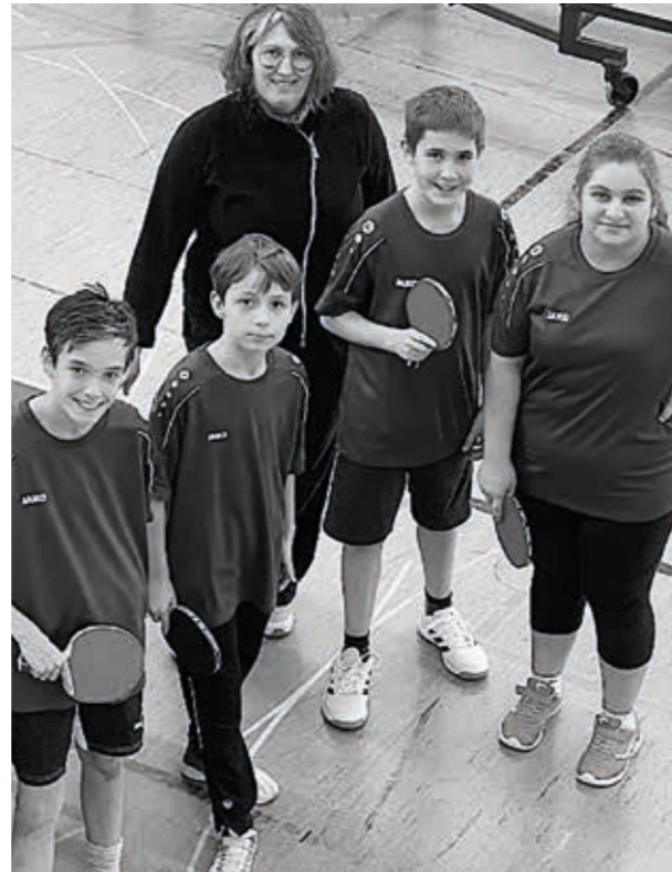
Die Jugendlichen der Jungen 13 nach dem Punktspiel

Mit dem Beginn der neuen Saison 2023/2024 erlebten wir einen kleinen Umbruch in der Jungen 13, da die meisten Kinder aus der Jungen 13 nun in die Altersklasse der Jungen 19 umgemeldet werden mussten. Diese Neuaufstellung sollte aber keineswegs einen Leistungseinbruch bedeuten. Das Team knüpfte an die starke letzte Saison an und sicherte sich den 2. Tabellenplatz der Kreisklasse zum Ende der Halbbrunde. Somit erlangte die Mannschaft die Berechtigung zum Aufstieg in die Bezirksklasse, in welcher die Spielerinnen und Spieler in der Rückrunde ihre Leistungen unter Beweis stellen werden.