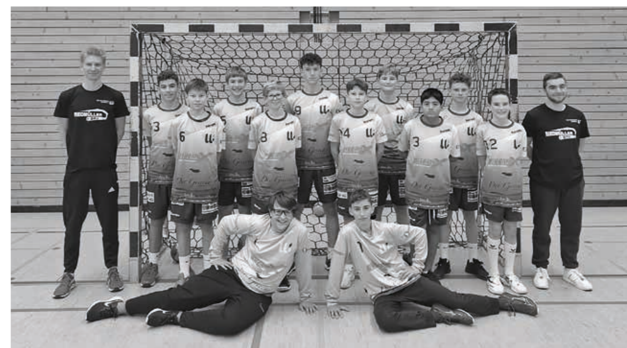
TSV Willsbach Handball männliche C-Jugend, Saison 2023/2024

Mittwoch 17:00 bis 18:30 Uhr (SCO) Freitag 17:00 bis 18:30 Uhr (SCO)