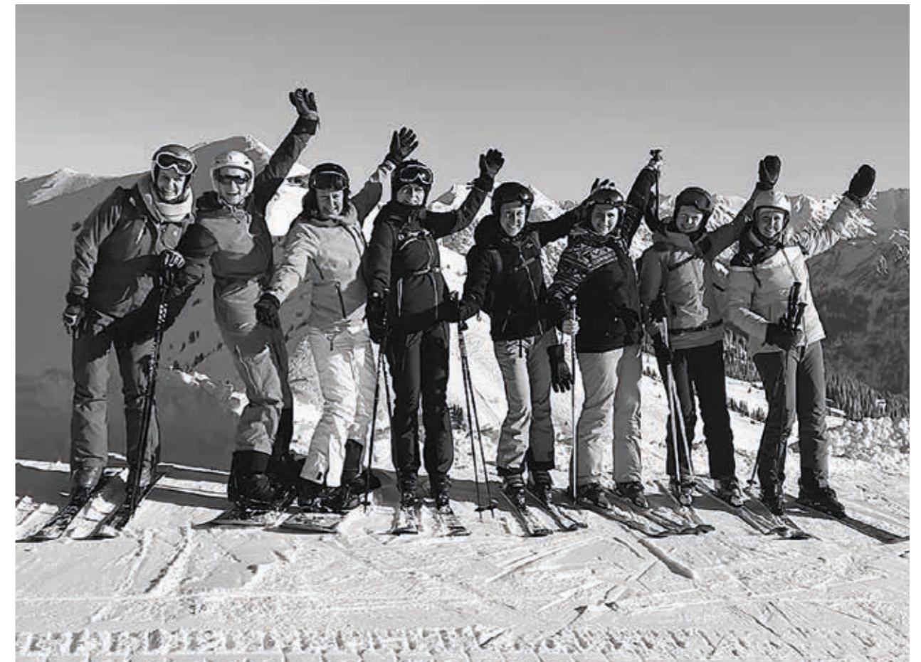
TSV Willsbach Volleyball, Skiausfahrt ins Kleinwalsertal

Die Skiausfahrt war ein voller Erfolg, geprägt von sportlicher Aktivität, guter Stimmung und gemeinsamen Erlebnissen auf und neben der Piste. Trotz des zwischenzeitlichen Verlustes einer Spielerin kehrten wir gemeinsam und verletzungsfrei – von einem blauen Fleck abgesehen – nach Hause zurück und waren bereit, am nächsten Spieltag wieder Vollgas zu geben!