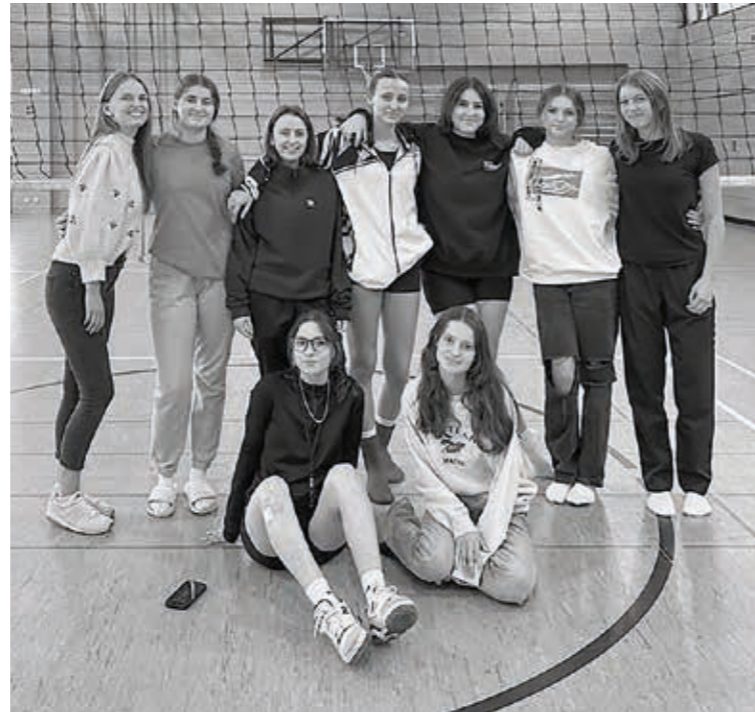
TSV Willsbach Volleyball weibliche Jugend U20

Die weibliche Jugend der Abteilung Volleyball