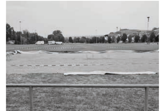
01.07.2023: Die Schalungen für die Fundamente stehen, sowie die Fertigstellung der Drainage.