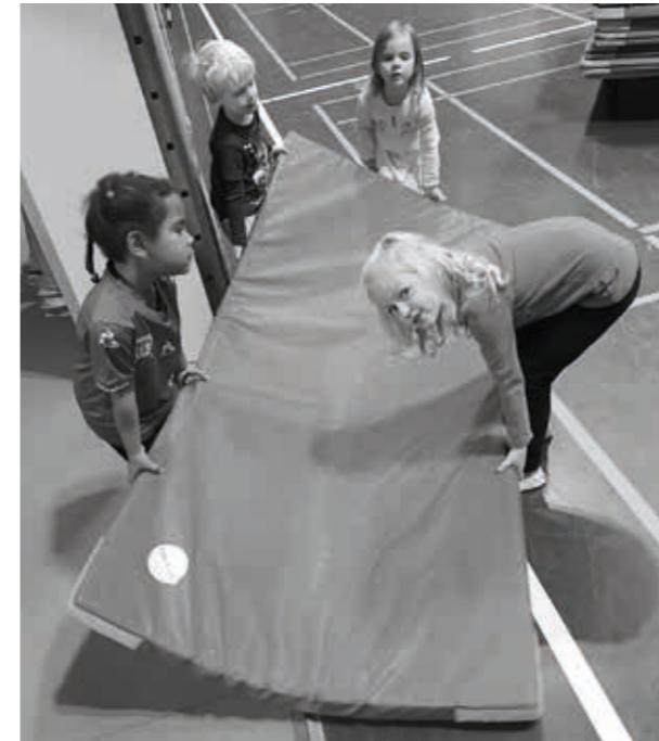
TSV Willsbach Kinderturnen