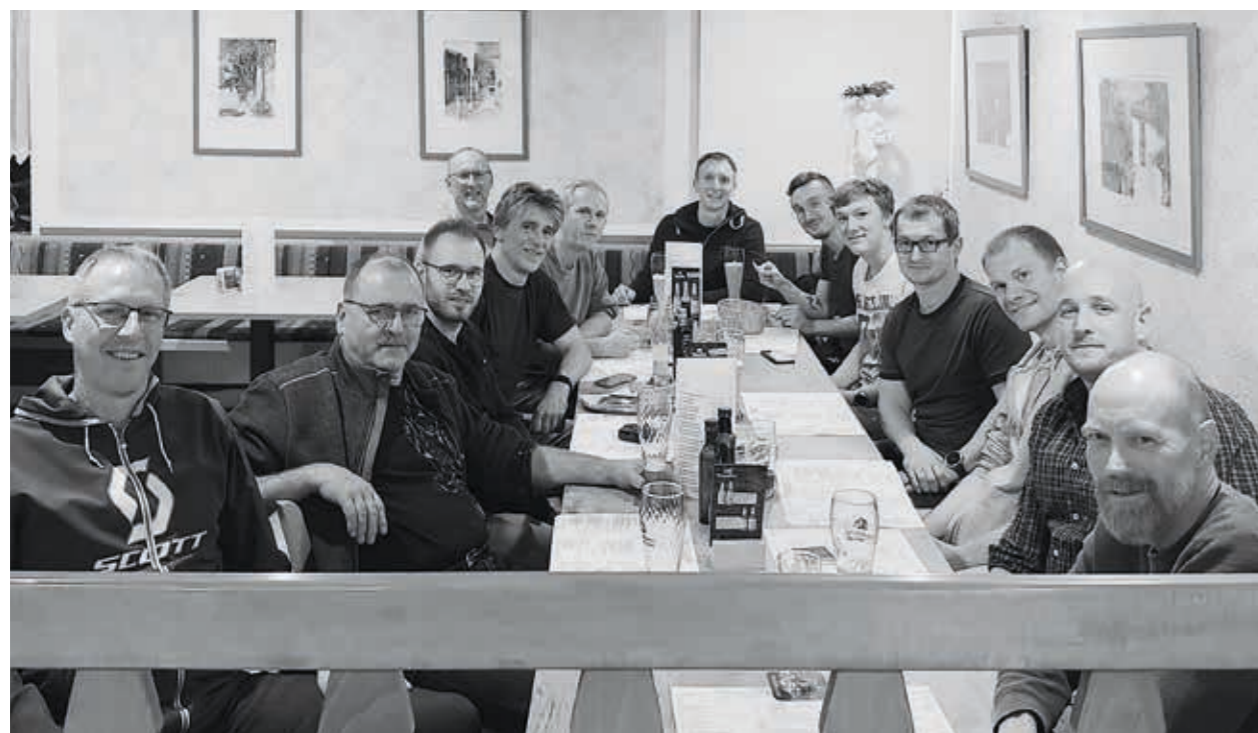
TSV Willsbach Freizeit Basketball, Jahresabschluss 2023 im TSV Sportheim