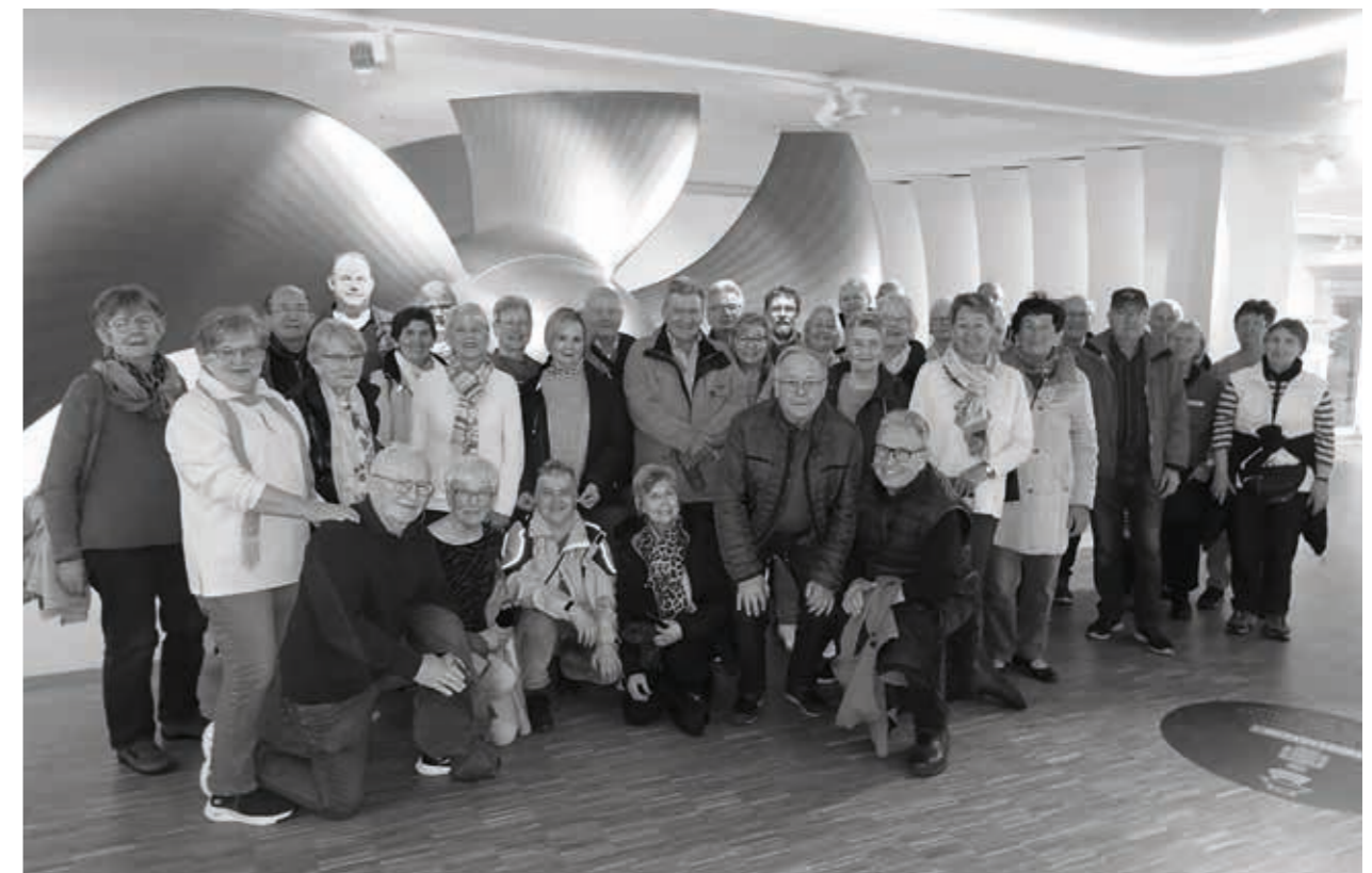
Schiffschraube in der Meyer Werft Papenburg

Ein Highlight des Jahres aber war: 5-Tage-Reise in Ostfriesland! Am 23.04. ging es los. Über Lüdenscheid – Oldenburg – Wilhelmshaven erreichten wir unser Hotel „Schützenhof“ im schönen Städtchen Jever. Am Tag 2 stand die Meyer Werft in Papenburg auf dem Programm. Bei einer Be-