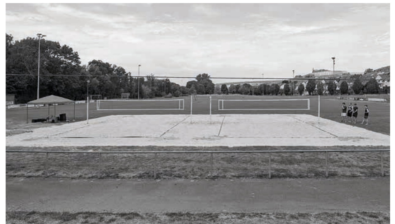
16.07.2023: Installation der Netze sowie der Begrenzungen des Spielfeldes