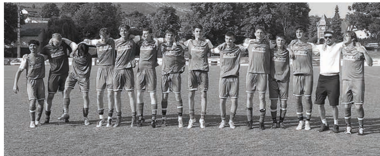
TSV Willsbach Fußball A-Jugend, Meisterschaft 2022/2023

Ich bedanke mich bei allen Trainerinnen und Trainern für ihren unermüdlichen Einsatz für unsere Jugendspieler.