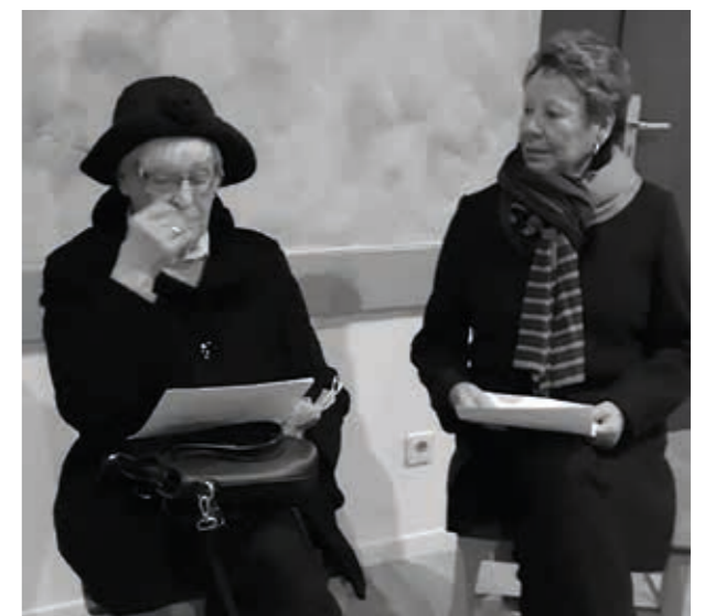
Weihnachtsfeier im TSV Sportheim