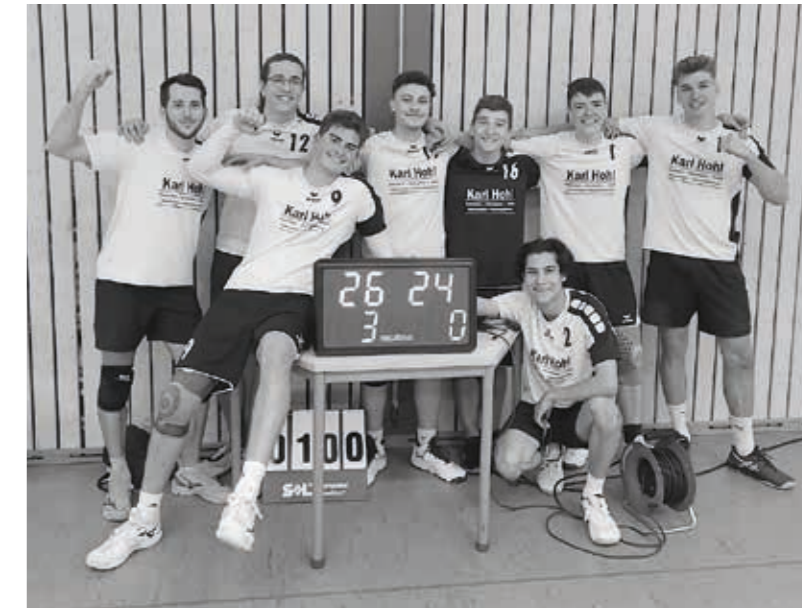
TSV Willsbach Volleyball Herren 2

Die zweite Mannschaft des TSV Willsbach blickt trainerlos (für Bewerbungen sind wir gerne offen), aber mit Zuversicht auf die Rückrunde und freut sich auf die kommenden Spiele.