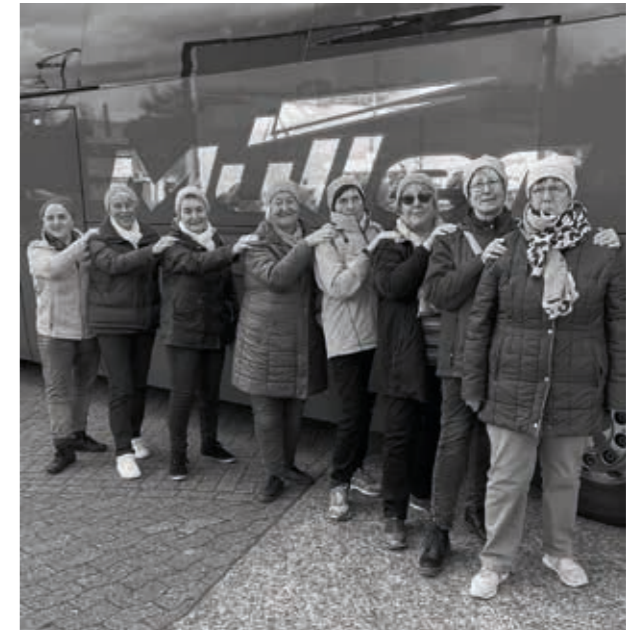
5-Tage-Reise nach Ostfriesland