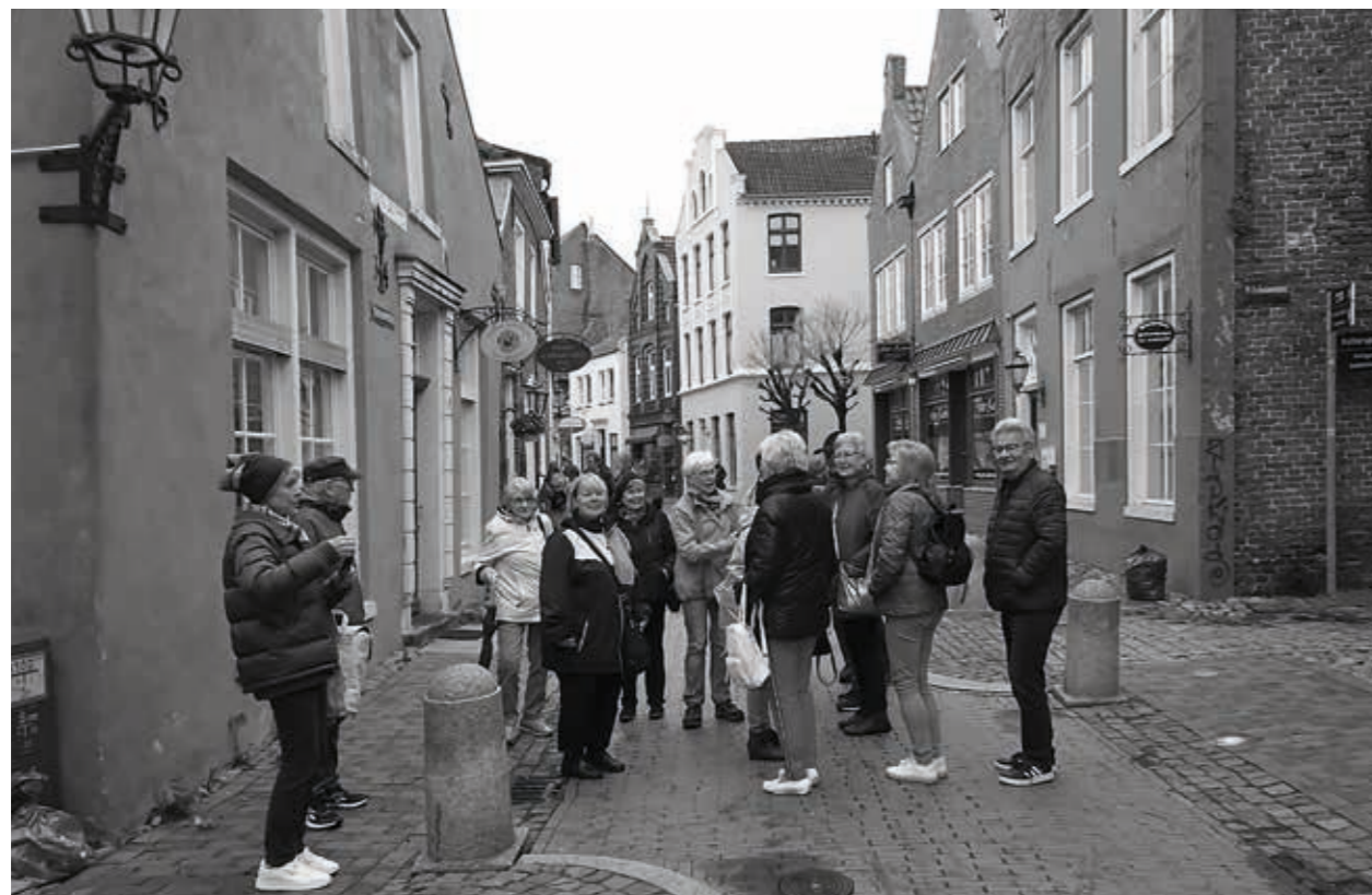
Die wunderschöne Altstadt von Leer

Berichte und Infos zu den TSV-Senioren Ü55 auch im Web unter: www.tsv-willsbach.de , in den Regionalblättern, in der Heilbronner Stimme sowie an den TSV-Aushangtafeln.