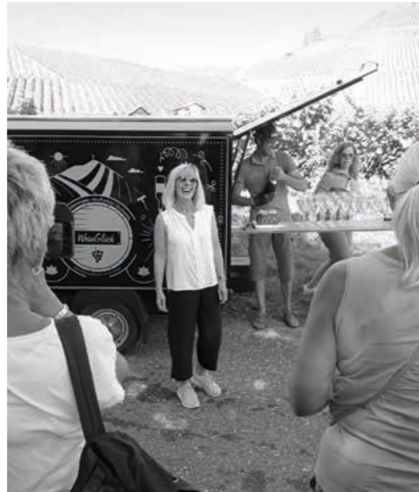
Weinwanderung, Scheuerberg Neckarsulm