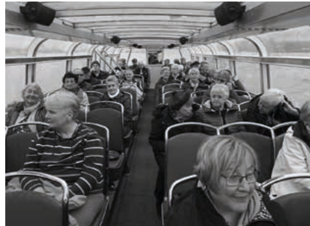
„Leinen los“ im Leereraner Hafen

sichtigung erlebten wir in unmittelbarer Nähe den arbeitsaufwendigen Produktionsprozess und den unvergleichlichen Glamour der Kreuzfahrtriesen. Im Besucherzentrum wurde uns ein umfassender Einblick in die Arbeit der Werft gegeben. Ich habe selten so viel Zustimmung für eine Werksführung erhalten. Ich selbst durfte an diesem Tag zum 3. Mal in der Werft sein. Anschließend ging es mit einer Führerin weiter durch die wunderschöne Altstadt von Leer. Um 15.00 Uhr hieß es „Leinen los“. Bei einer Schiffsrundfahrt entdeckten wir den Leereraner Hafen. Vom Wasser aus war die Sicht auf Leer besonders interessant. Wieder an Land kehrten wir in eine original „Ostfriesische Teestube im Hafen“ bei Ostfriesentee + Krintstuuten ein. War sehr gut!