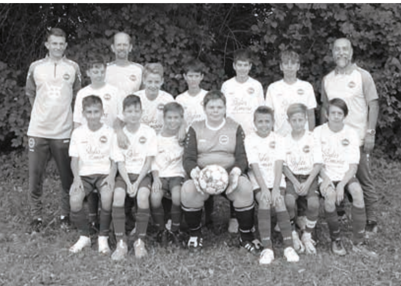
TSV Willsbach Fußball D1-Jugend