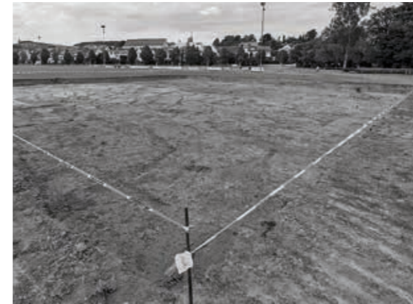
27.06.2023: Das Fundament ist ausgehoben.