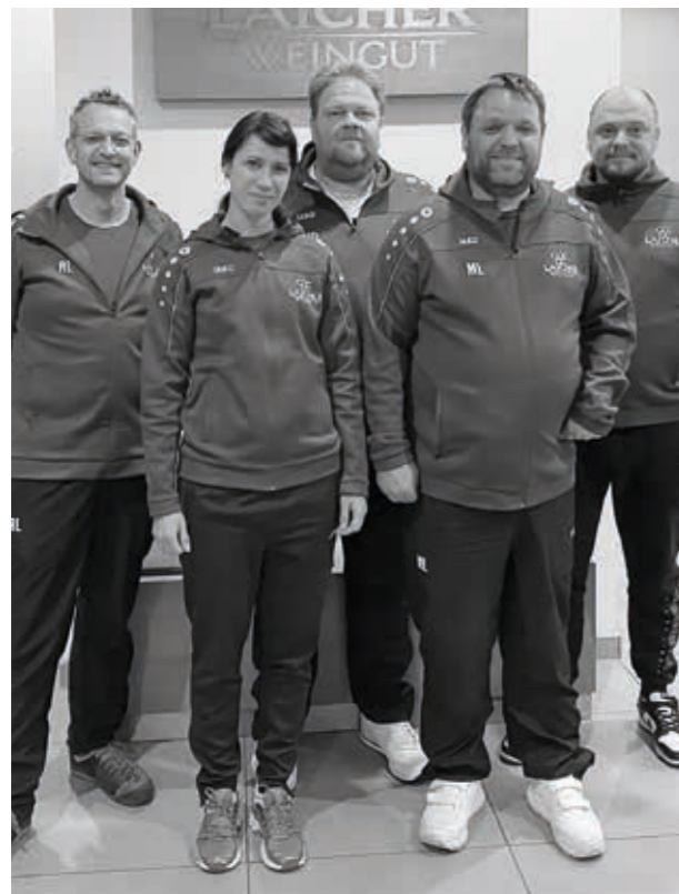
„Die Zweite“ in der aktuellen Besetzung

Die derzeit beste Einzelbilanz aus der Vorrunde hält Döri mit 12 Siegen aus 16 Spielen.