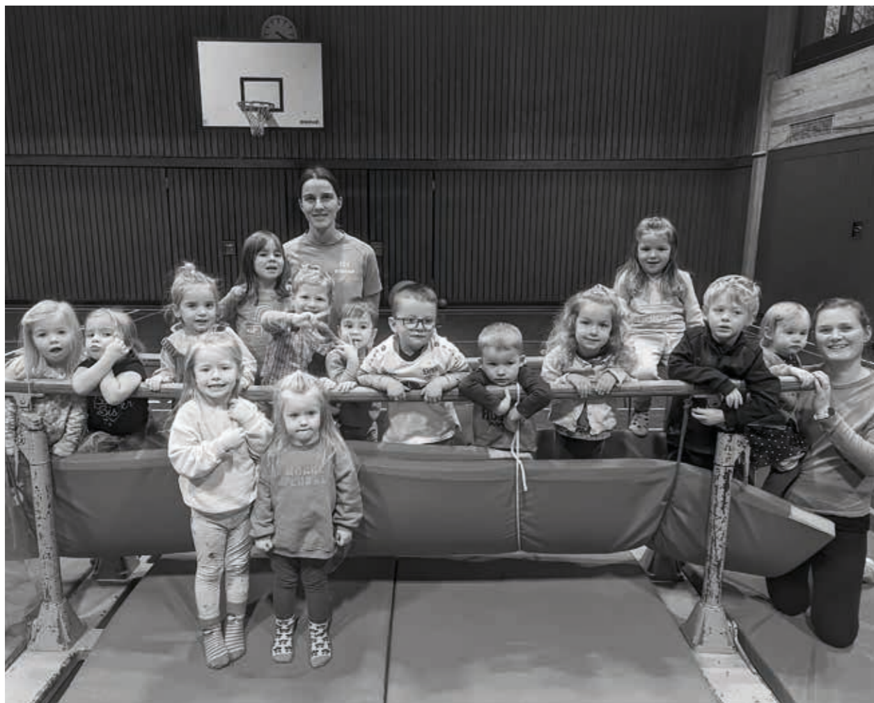
TSV Willsbach Eltern-Kind-Turnen

Mädchenturnen (6 bis 10 Jahre) Dienstag 18:15 Uhr bis 19:15 Uhr