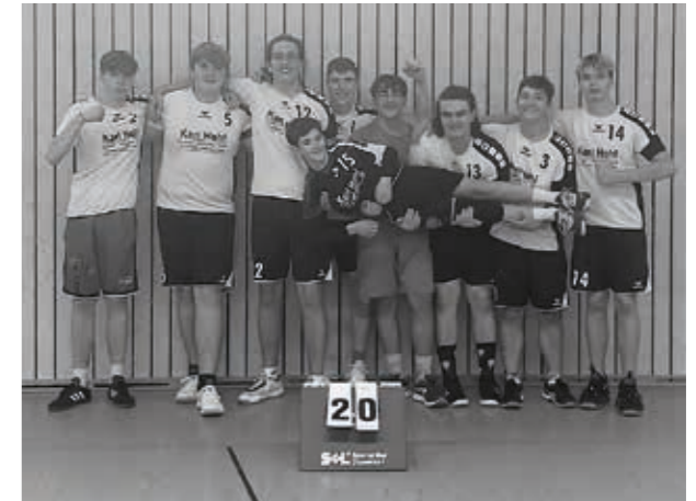
TSV Willsbach Volleyball männliche Jugend U20

Den erschwerten Bedingungen aufgrund der knappen Hallenkapazität zum Trotz zeigt sich im Training eine hervorragende Zusammenarbeit mit