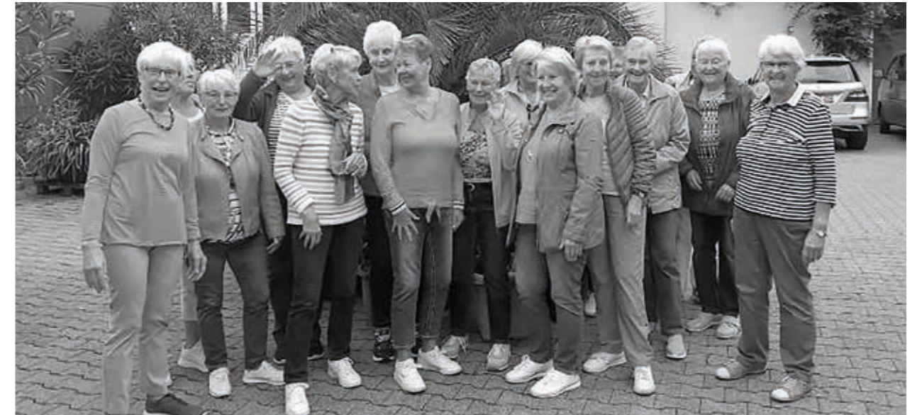
Geselliger Besenabend im Weingut Laicher