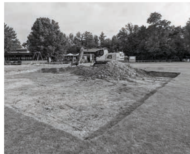
26.06.2023: Startschuss! Erste Grabungen des 26 x 24 Meter großen Lochs