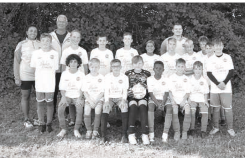
TSV Willsbach Fußball D2-Jugend