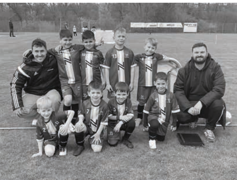
TSV Willsbach Fußball Bambini

Wie bereits einige Jahre beklage ich hier in unserem Jahresbericht die Bereitschaft der Menschen zum Ehrenamt. Immer schwieriger finden sich Leute, die bereit sind, ein Traineramt auszufüllen. Zu vielfältig sind die Ausreden, die jeder findet, um abzusagen. Gleichzeitig sind es häufig genau diese Leute, die Kindern vorwerfen, nicht genug zu tun und sich zu wenig zu bewegen. Kinder und Jugendliche suchen Vorbilder und wenn man ihnen das Engagement und den Enthusiasmus für Bewegung und Sport vorlebt, kann man bei allen Kindern und Jugendlichen viel erreichen. Ich hoffe, unsere Gesellschaft und besonders unser Verein schafft es nach meinem Ausscheiden nach über 15 Jahren Jugend- und Vereinsarbeit, meistens in mehreren Ämtern gleichzeitig, wieder mehr Leute zu motivieren. Ich würde mir es wünschen, schon allein den Kindern zuliebe.