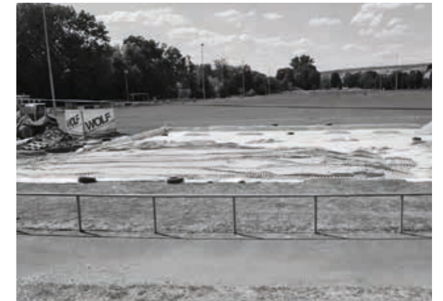
07.07.2023: Der Sand rollt an und wird über das Feld verteilt.