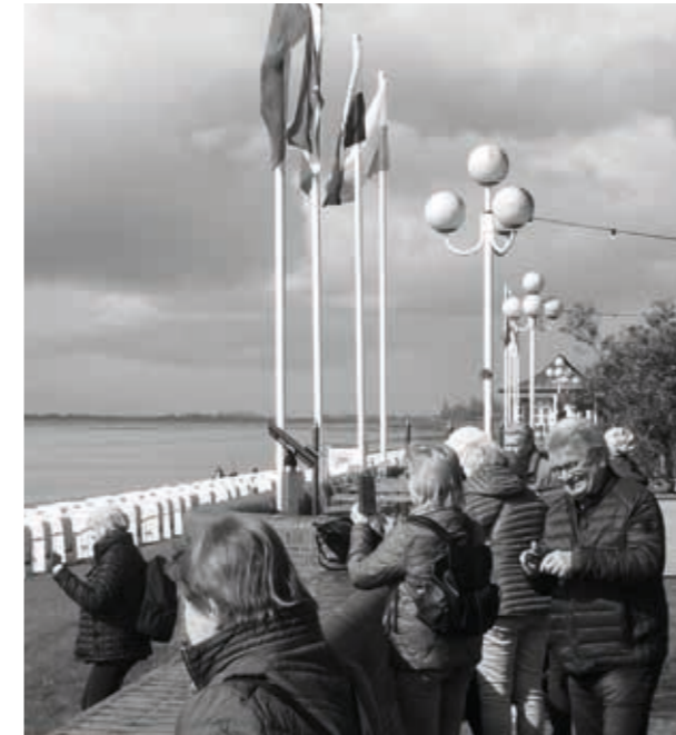
Die TSV Senniores Ü55 in Wilhelmshaven

stand Wilhelmshaven auf dem Programm. Mit dem Schiff ging es zu einer interessanten Fahrt durch den Marinehafen. Zu den Tankerlöschbrücken und zum JadeWeserPort. Wir erlebten wie 350.000 Tonnen schwere Supertanker ihre Fracht löschten. Der JadeWeserPort ist Deutschlands einziger Tiefwasserhafen. Da sollte unsere Politik aufwachen, dass hier endlich weiteres getan wird. Das kleine Holland hat uns zum Beispiel schon lange überholt. Bei einer Busrundfahrt lernten wir die Stadt Wilhelmshaven näher kennen.