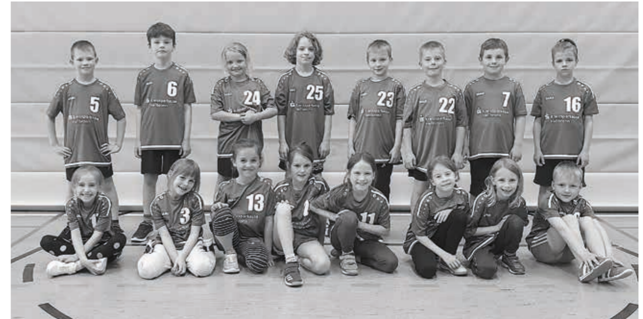
TSV Willsbach Handball gemischte F-Jugend, Saison 2023/2024

Leistungen und schlossen die Saison in der Spitzengruppe ab. Nach dem letzten Spiel im März verabschiedete sich der größte Teil der Kinder erfolgreich in die D-Jugend.